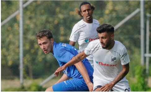
Der erste Spieltag in der Landesliga startete mit dem Derby SSG Ulm 99 gegen TSV Neu-Ulm.

27. August 2020, 18:30 Uhr • Ulm Von Dettlef Groninger